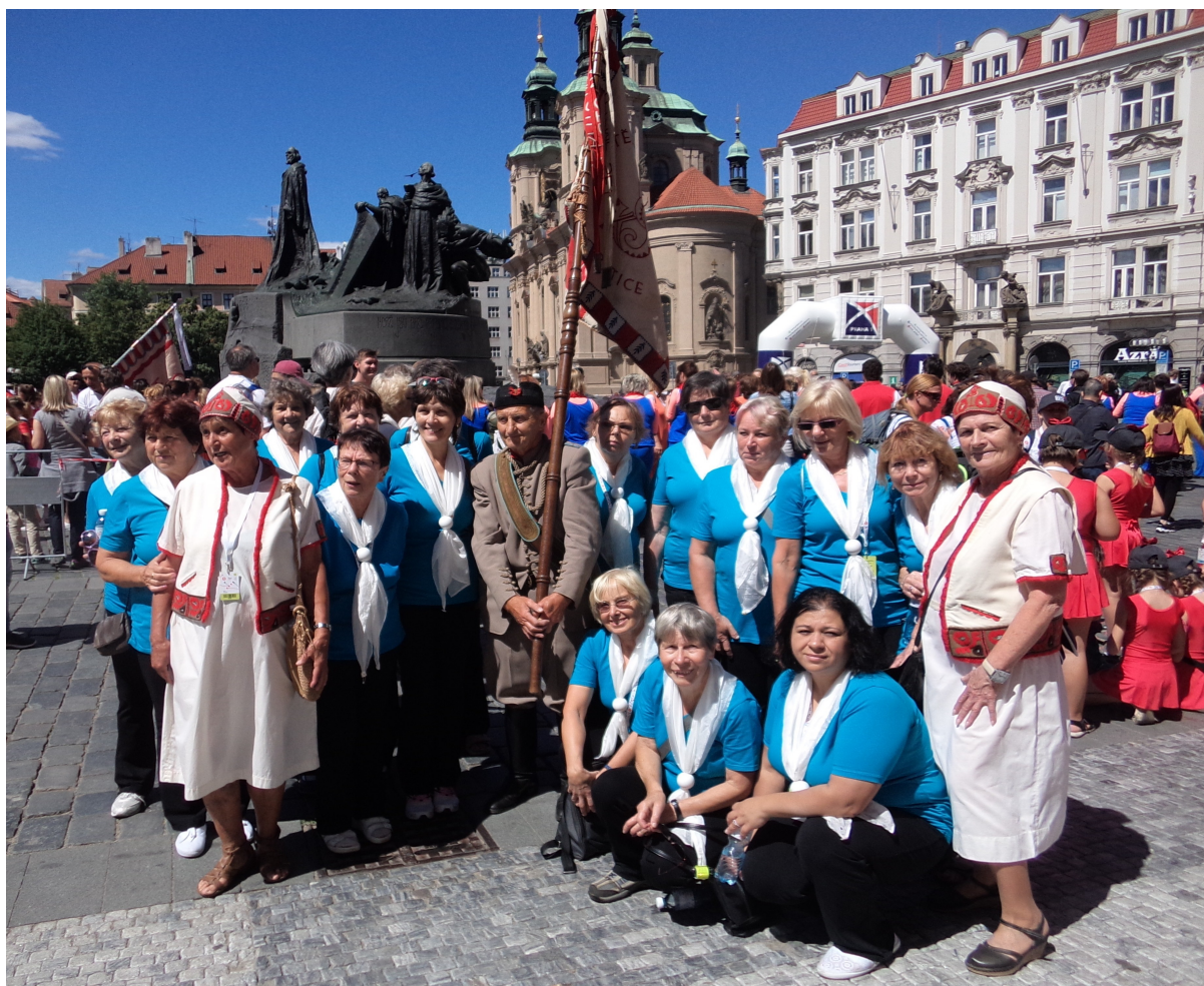
XVI. Všesokolský slet 2018 za účasti Sokolů z Velkých Hamrů – str. 23-24