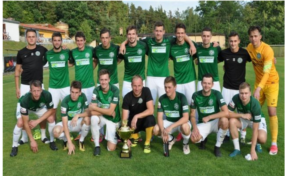
Vítězné družstvo krajského přeboru