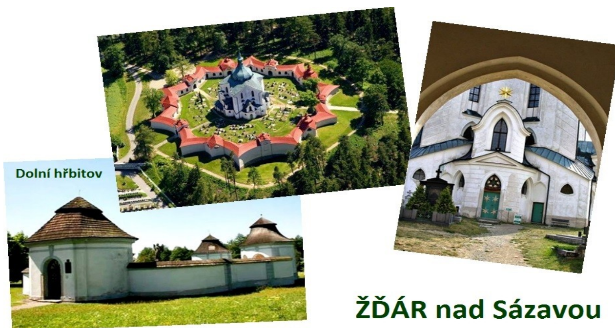
ŽĎÁR nad Sázavou