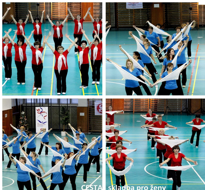
Foto z předvedení sletových skladeb

V pátek 6. 7. vyvrcholil XVI. všesokolský slet odpoledním představením opět 10 skladeb, tentokrát se předvedly i nejmladší skupiny cvičenců, předškoláčků, i s rodiči. Také hamrovské cvičenky dostaly ve skladbě Cesta příležitost ukázat, že se dobře na tuto slavnost pohybu a vytrvalosti připravily! Díky patří všem, které obětují čas i finance v náročné a dlouhodobé přípravě! Komponovaný závěr byl zaměřený na oslavu 100 let od vzniku naší republiky. Historické postavy našich dějin defilovaly pod vlajkami Čechů, Slováků i Sokola. Ojedinelé vystoupení představilo vítězství píle, obětavosti a nadšení, především u velkého počtu mladých cvičenců, kteří ukázali, že naše mládež, dostane-li příležitost, je zárukou budoucnosti i v Sokole!