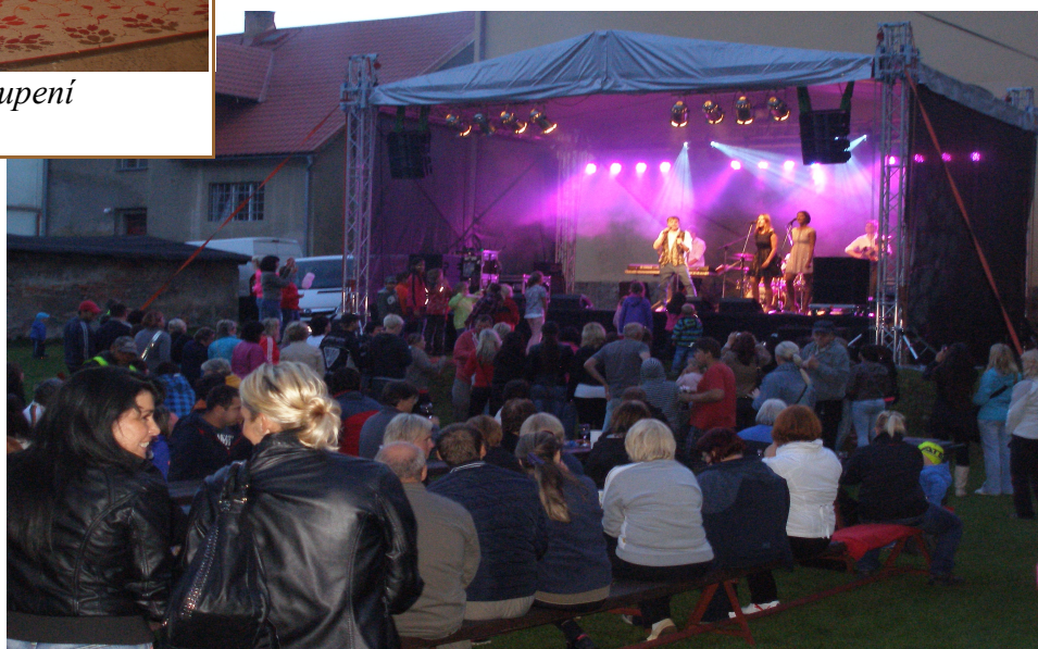
Petr Kotvald - koncert