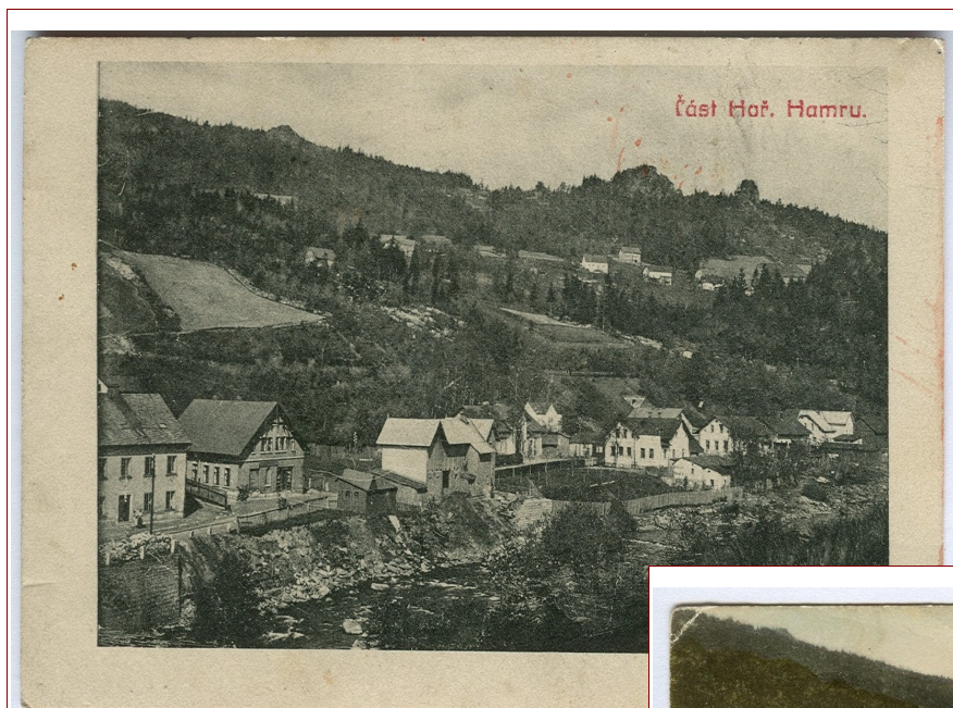
Část Hořeního Hamru

Dřívější pojmenování obcí Hamersko, Dolní a Hoření Hamr souvisí se železnými hamry, které zde stávaly pravděpodobně ve 13. a 14. století. Původní obcí a střediskem bylo Hamersko, ( dnešní Hamrska - dělníci odtud chodili pracovat do hamrů zpracovávajících železnou rudu do Plavů a do Hamrů ). Není divu, že si tehdejší obyvatelé vybrali pro život místo s tak krásným výhledem daleko do kraje, vždyť co by kromě vody bylo vidět dole u Kamenice? Údolí se ale v 1. polovině 19. století zalíbilo průmyslovému magnátovi Johannu Liebiegovi. Voda totiž byla výhodný energetický zdroj pro pohon strojů, a tak tady v letech 1844-45 začal stavět textilní továrnu, což byl podnět k osídlování údolí. Druhou továrnu postavil v roce 1908 na Mezivodí. Lidé zde měli práci a údolí řeky Kamenice se zalidnilo. Hamersko ztrácelo na významu a obchodním a společenským centrem se staly obce Hoření a Dolní Hamr pod kopcem.