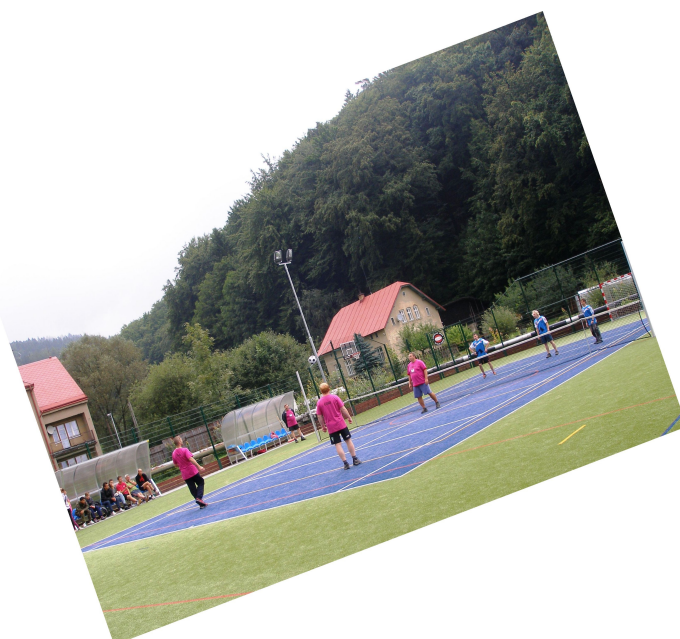
Nové hřiště- turnaj nohejbal