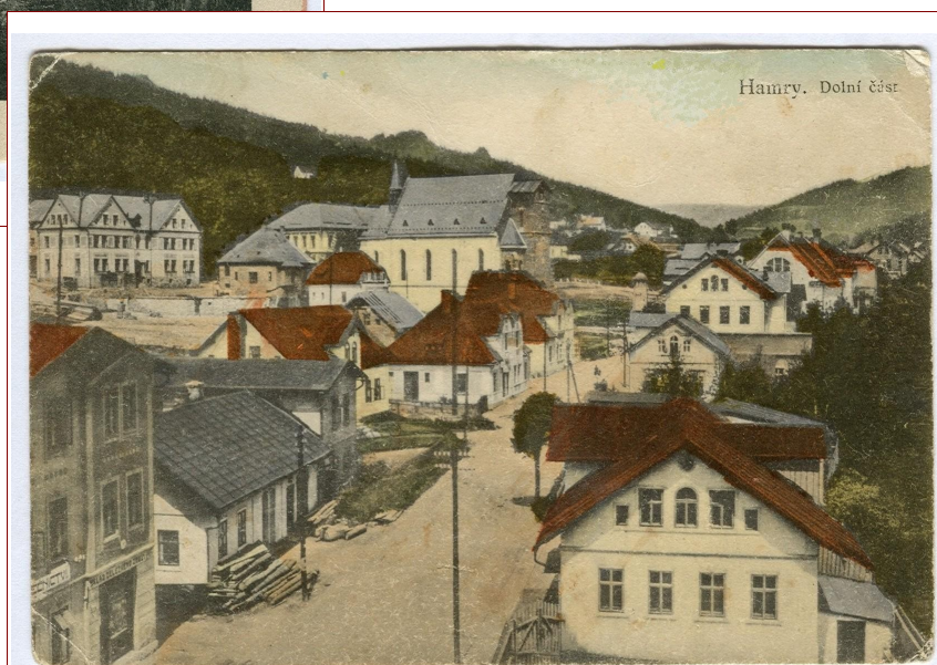
Hamr Dolní část