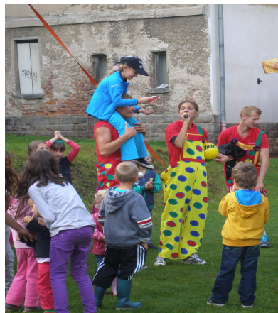
Český animační team