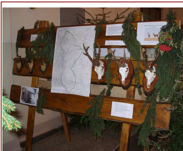
Sokolovna -výstava trofejí myslivci