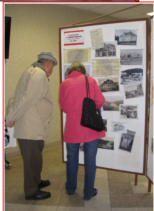
MěÚ - Historie Velkých Hamrů obrazem