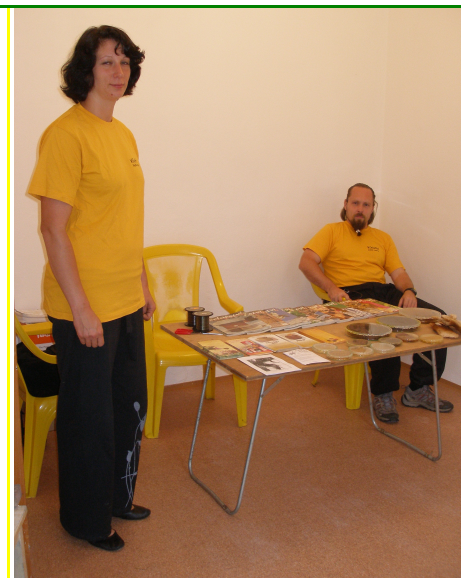
Stará školka - U včelaříků