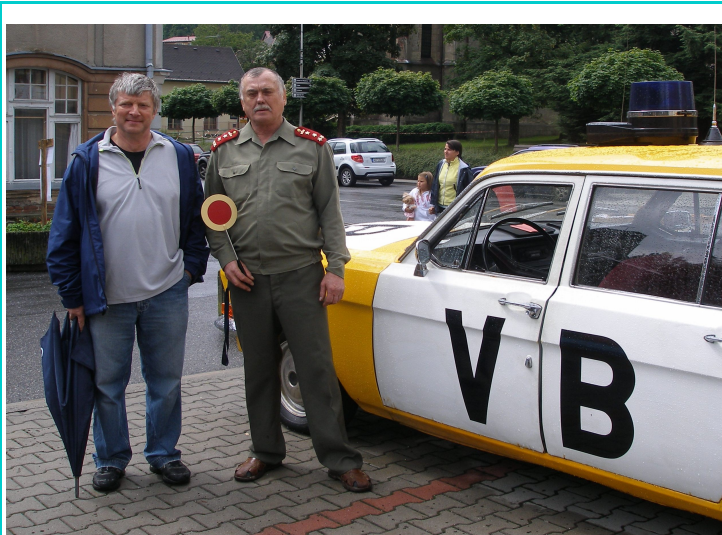
Náměstí - Muzeum socialistických vozidel