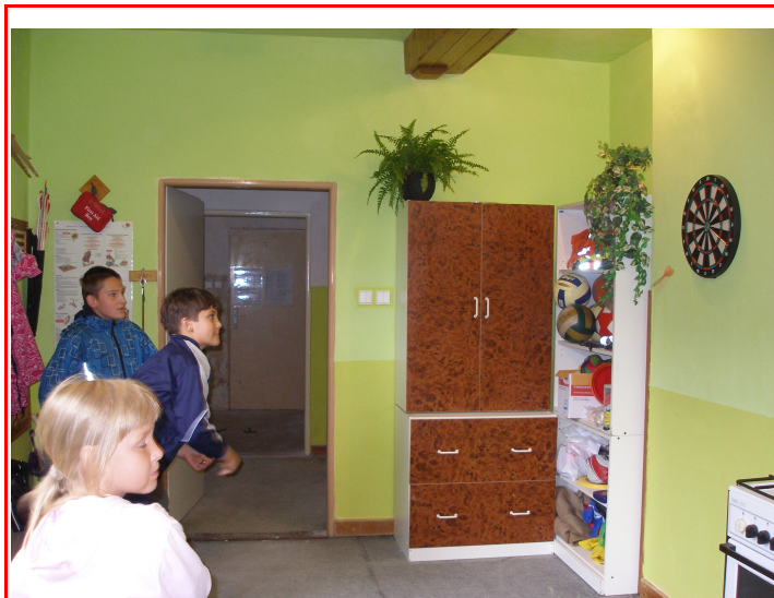
Stará školka -U Liščat