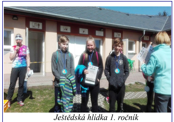
Ještědská hlídka 1. ročník