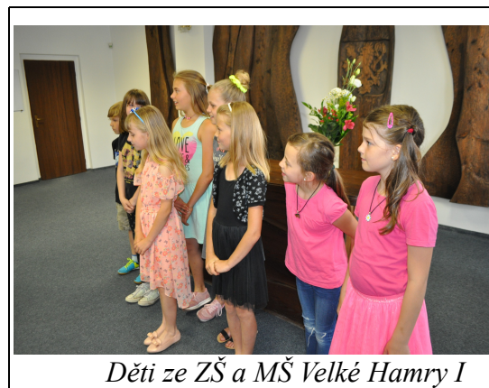
Děti ze ZŠ a MŠ Velké Hamry I