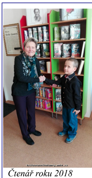
Čtenář roku 2018

V rámci března měsíce čtenářů proběhlo v naší knihovně dne 20.3. 2019 jako vždy v tomto měsíci vyhlášení čtenáře roku za uplynulý rok 2018. Oceněn je čtenář, který přečetl nejvíce knih, a to jak v dospělém, tak dětském oddělení.