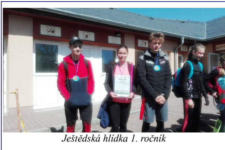
Ještědská hlídka 1. ročník

- střelba ze vzduchovky na cíl, lanová lávka, hod granátem na cíl, vědomostní test, army test, zdravotní test, topografie. Jednotlivé disciplíny plnil každý z družstva a za nesplnění disciplíny bylo družstvo penalizováno časovou ztrátou. Závod jsme vzali zodpovědně a žáky naší školy připravovali v hodinách tělesné výchovy, kde posilovali, aby hravě zvládli army test v podobě pěti shybů. Dále jsme poučili o zdravotní, trénovali hody a dokonce měli možnost zastřílet si ze vzduchovky na cíl. Závodu se zúčastnilo 5 družstev naší školy. Díky pěknému počasí a doprovodnému programu si účastníci závodu velice užili, k celkové spokojenosti pomohlo i občerstvení po dokončení závodu. Sladkou tečkou byla úspěšná reprezentace školy a umístění 6. a 8. ročníku na krásném 3. místě.