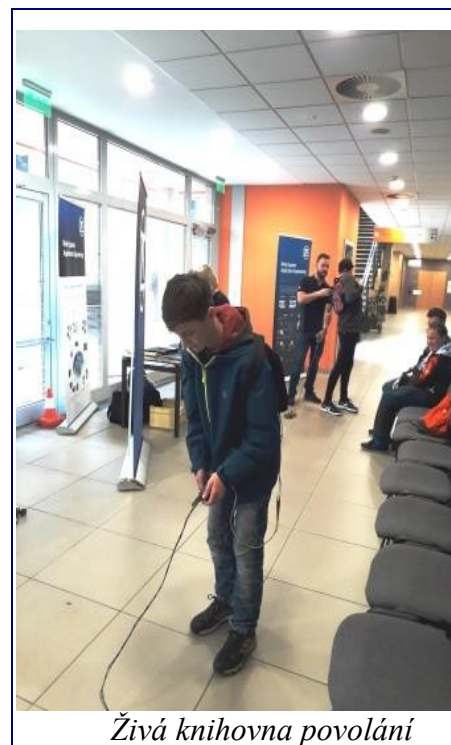
Živá knihovna povolání

Žáci 8. ročníku navštívili 24. 4. 2019 akci Živá knihovna povolání v Eurocentru v JBC. Živá knihovna povolání, co si pod tím představit? Jednoduše osm firem prezentující pozici u nich ve firmě, pozici, která má budoucnost. Jednotliví zástupci firem nám neřekli pouze o tom, o co v té firmě jde a co vyrábějí, ale i o tom, s jakým vzděláním a školou nás přijmou a jaké kurzy a školení nám mohou poskytnout. Tuto pozici nám přiblížili se vším všudy, i s problémy, které by mohly nastat. Předvedlo se osm firem. Například firma