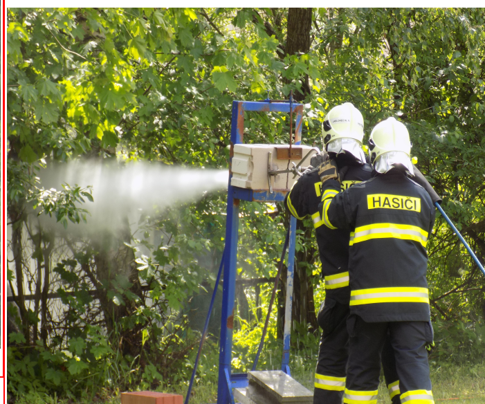
Ukázka techniky hasičského zařízení Cobra