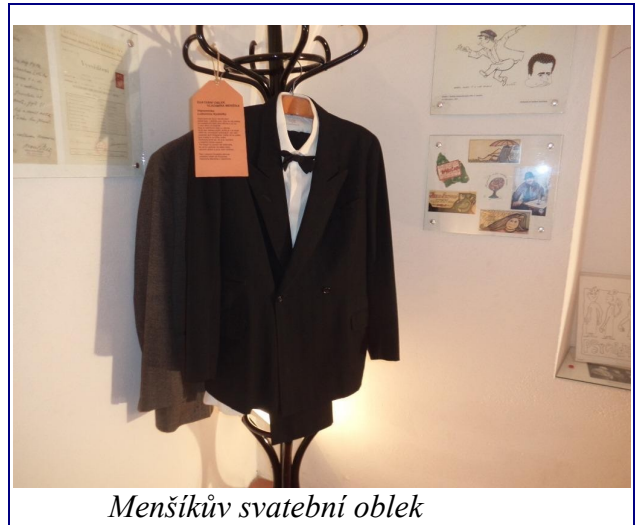
Menšíkův svatební oblek