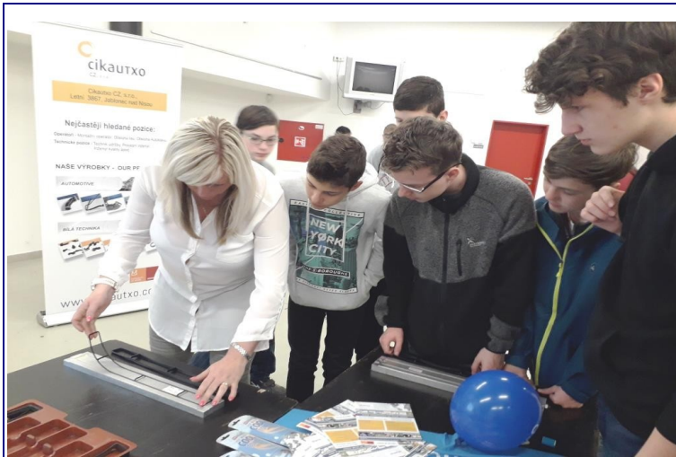
Živá knihovna povolání

Preciosa a. s. s pozicí produktového designera, nebo dále třeba firma ABB s pozicí konstruktéra a další. Zbylými firmami byli TRW (zkušební řidič), Úřad práce (karierní poradce), Cikautxo (technik kvality), ARaymond (CAD designer), dále třeba Česká mincovna a. s. hned s několika pozicemi (rytec, ředitel atd.) a nakonec Nemocnice Jablonec nad Nisou (sanitární sestra na sále, praktická sestra). Bylo to velice zajímavé a dost nám to všem rozšířilo obzory o budoucím zaměstnání.