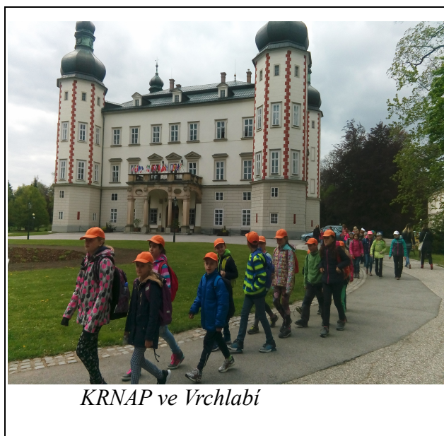
KRNAP ve Vrchlabí