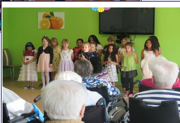
Vystoupení v Domově důchodců