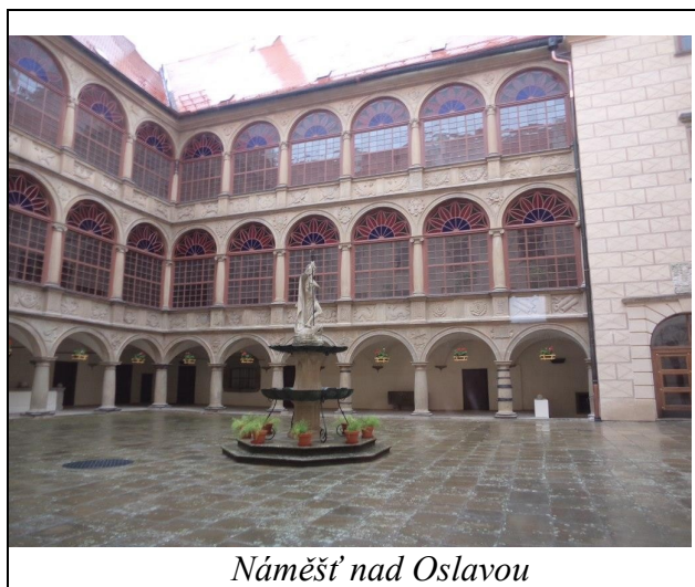
Náměšť nad Oslavou

zde hvězdy jako Lucie Bílá, Lukáš Krpálek, Karel Gott a velká řada umělců, sportovců i politiků.