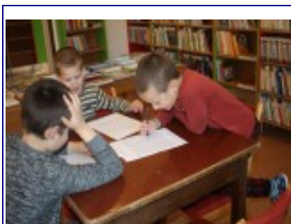
Noc s Andersenem