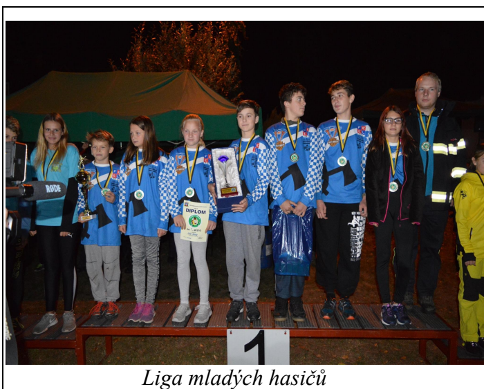
Liga mladých hasičů

V pátek 24. května byla Tanvaldská kotlina vyhrazena mladým hasičům z celého okresu. V rámci tábora, který každoročně připravují hasiči z Tanvaldu Šumburku, bylo i vyhlášení Jablonecké ligy mladých hasičů. Starší žáci z Velkých Hamrů obsadili v silné konkurenci celkové třetí místo, což je opět velký úspěch.