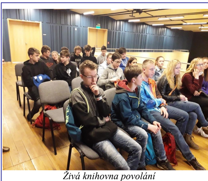
Živá knihovna povolání