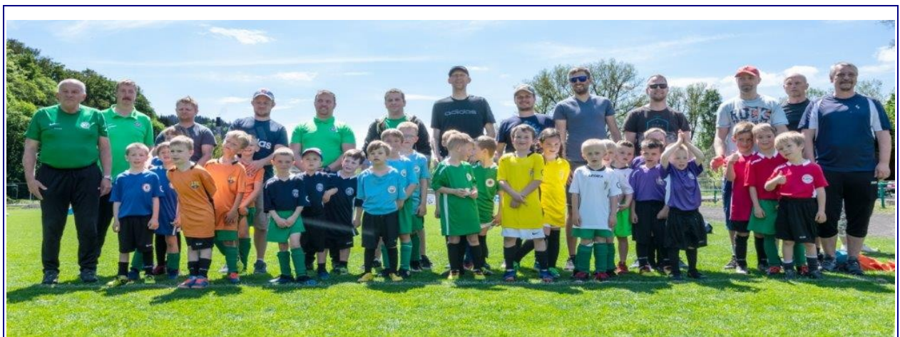
Liga mistrů ve Velkých Hamrech